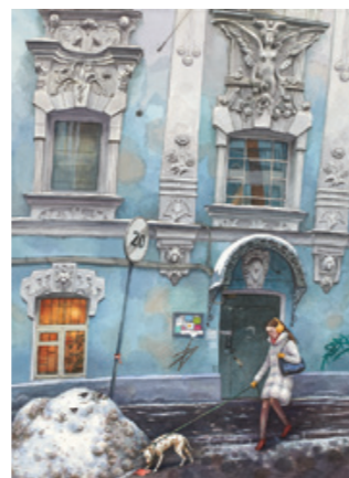
^ В Большом Козихинском переулке, 2013. 78×58 см