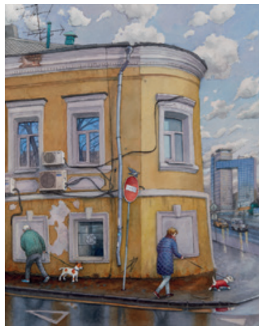
^ Дом на углу улицы Сергея Радонежского и Хлебникова переулка, 2018. 77×57 см