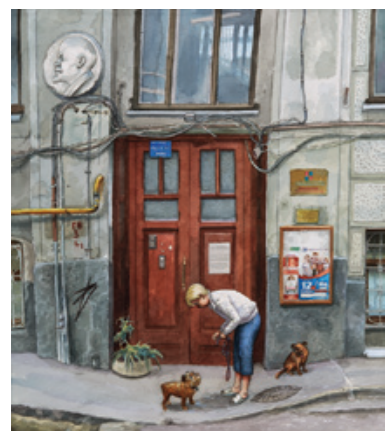
Первый памятник вождю. Печатников переулок, дом 22. 2015. 56×50 см