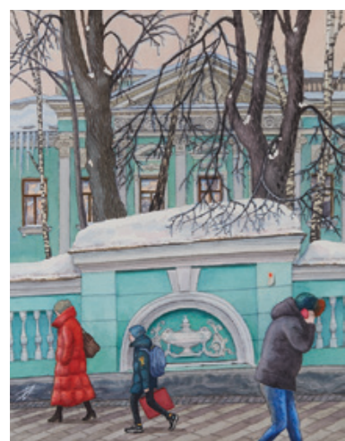
Пречистенка, Дом ученых. 2019. 58×44 см