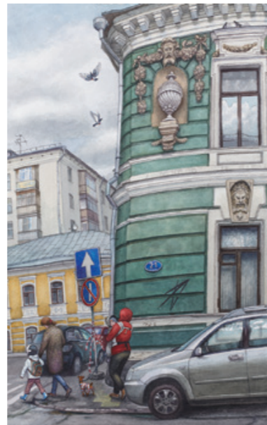
< Подсосенский переулок, дом 21, 2012. 78×48 см > Дворик на улице Щипок, 2013. 48×78 см